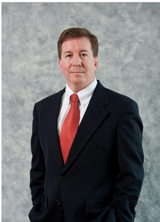
中国美国商会主席 葛国瑞